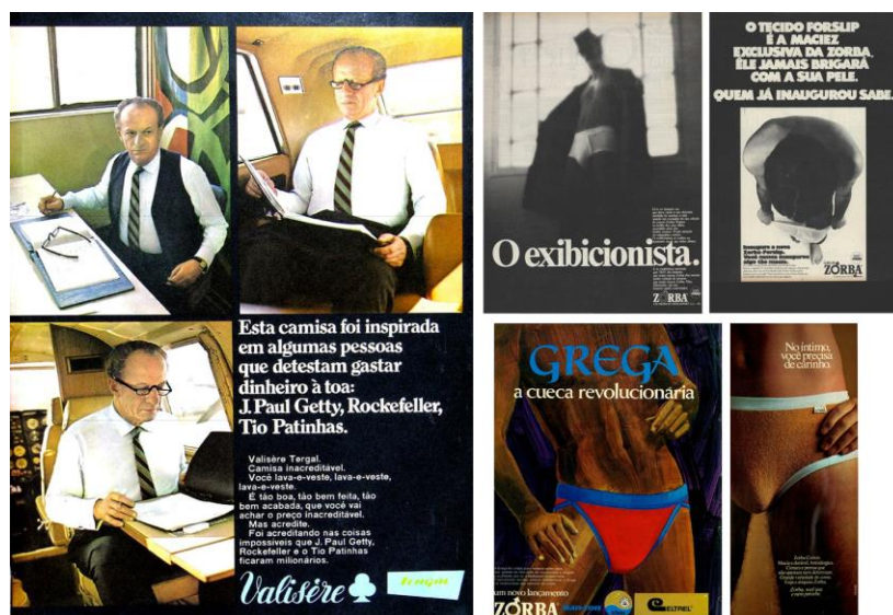
Figura 1: masculinidade hegemônica e outras masculinidades publicitárias

Na Figura 1 (anúncio do lado direito), podemos ver essa representação social de masculinidade hegemônica também tornada midiática, circulante até a década de 1990 (HOFF, 2008). Mas, nesse período, é possível contemplar, fruto de algumas movimentações sociais e políticas, a inserção dessas outras masculinidades (lado esquerdo), antecipando, mesmo que de forma tímida e implícita, aquelas representações que pesquisadores contemporâneos a nós afirmaram começar a circular na década de 2000, com corpos masculinos “desnudo em poses sensuais” (HOFF, 2008, p. 180).